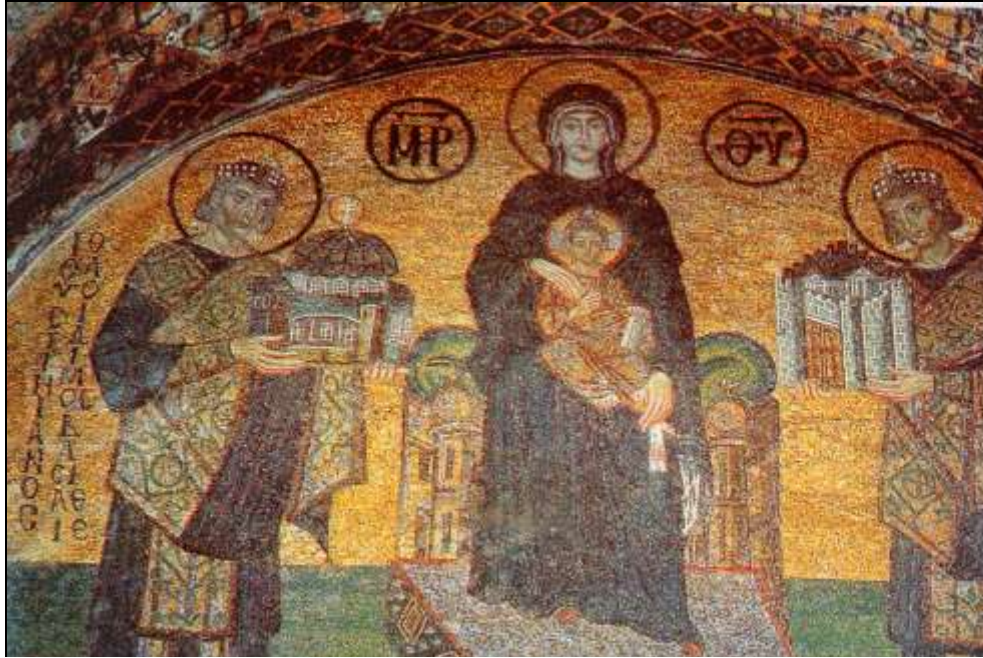
Doc1 : une mosaïque dans Ste Sophie

I/ Etude de documents (répondre sur votre copie en veillant à reporter le n° du document et en veillant à chaque fois à reprendre la formulation de la question (8pts)